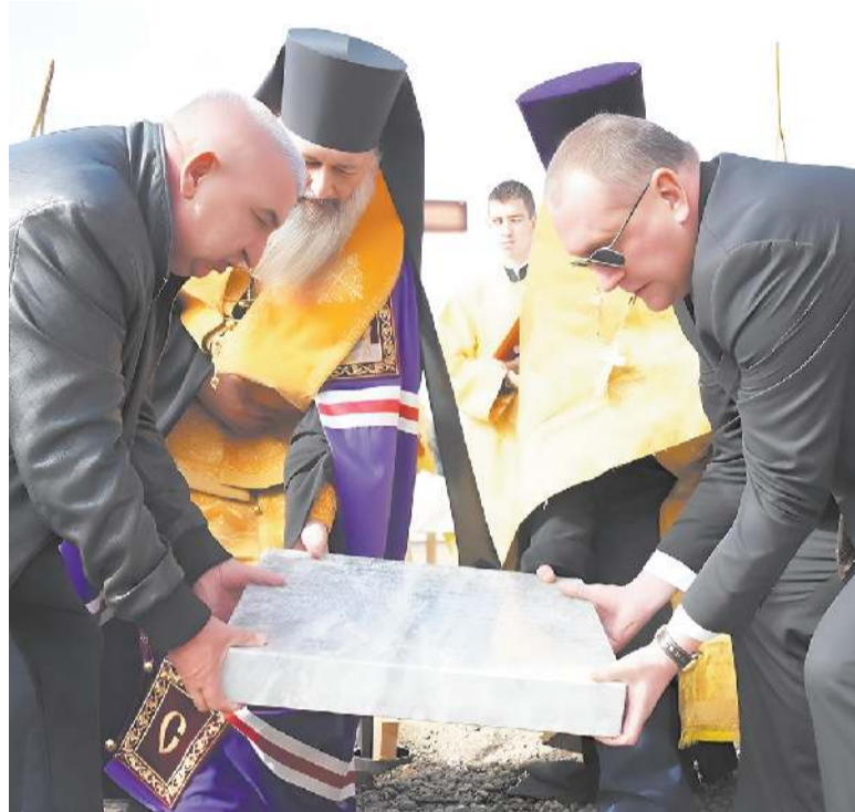
Закладка камня в основание нового храма.