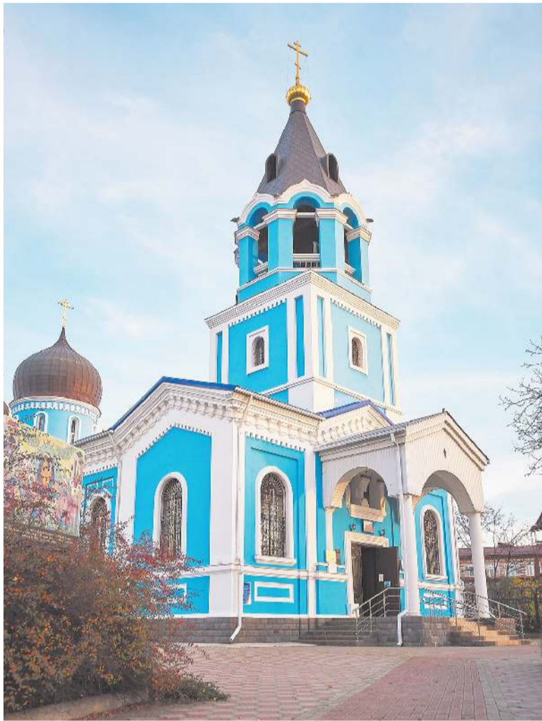
Соборный храм Успения Пресвятой Богородицы г. Лабинска.

сюда. Месяц давайте, — рассказывает она.