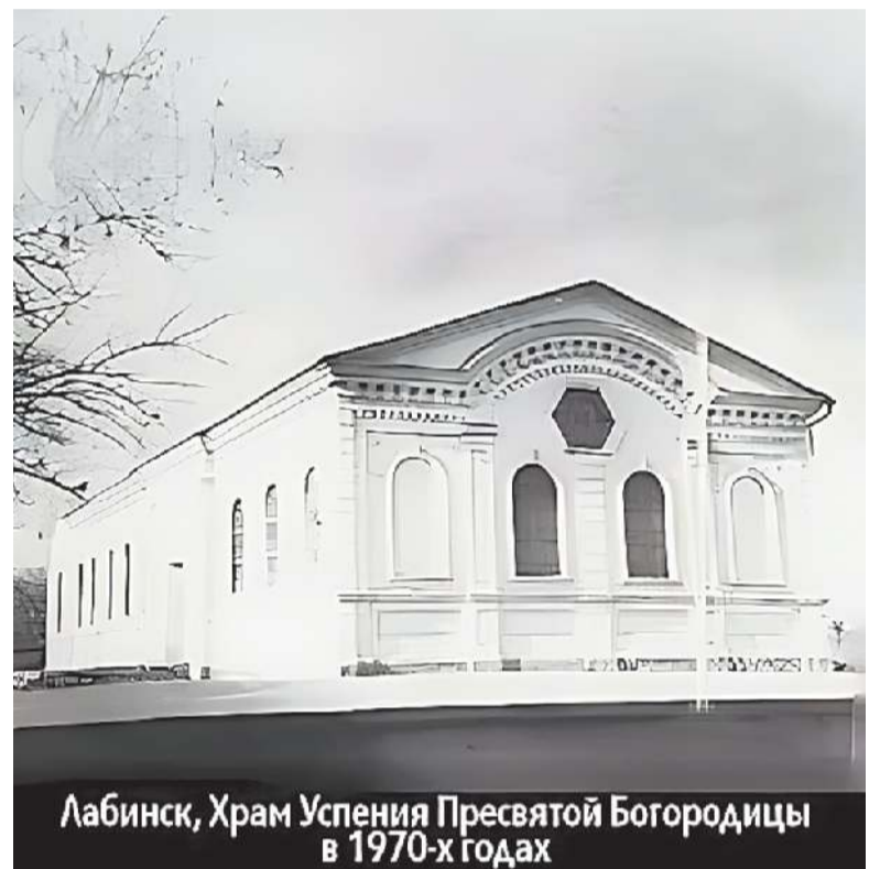
Лабинск, Храм Успения Пресвятой Богородицы в 1970-х годах

Особенно трагичными выдались дни декабря 1960 года, когда храм был превращен в клуб, а затем в спортивный зал рядом построенной общеобразовательной школы. В архивах