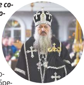
САВВА, епископ Армавирский и Лабинский

Желаю вам укрепляющей благодати Духа Святого, помощи Божией в трудах и заботах о вечном спасении и благоуукрашении святыни города Лабинска – соборного храма Успения Пресвятой Богородицы!